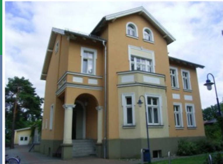
Kulturhaus Friedrich Wolf